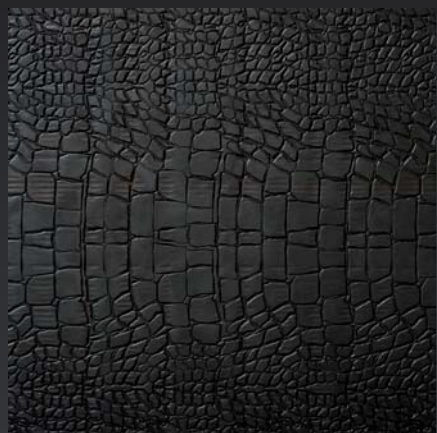
Pelle di cocodrillo

I parquet che valorizzano il legno. The parquets that enhance wood.