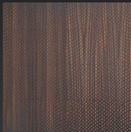
Pelle di pitone