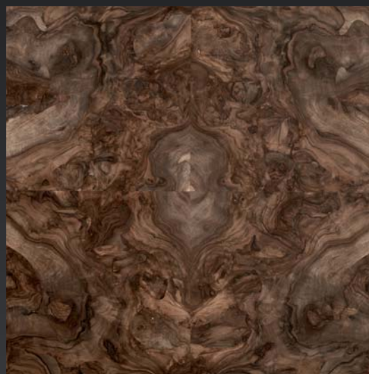
Radica di noce centrata