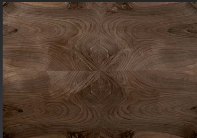
Piuma di noce

I parquet che valorizzano il legno. The parquets that enhance wood.