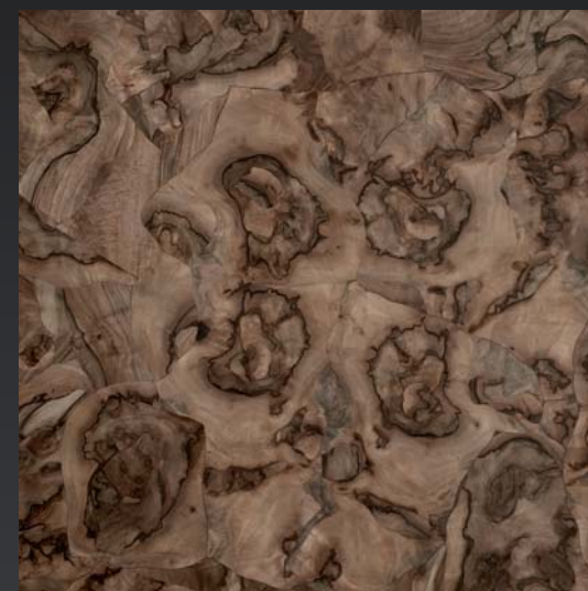
Radica di noce a palladiana